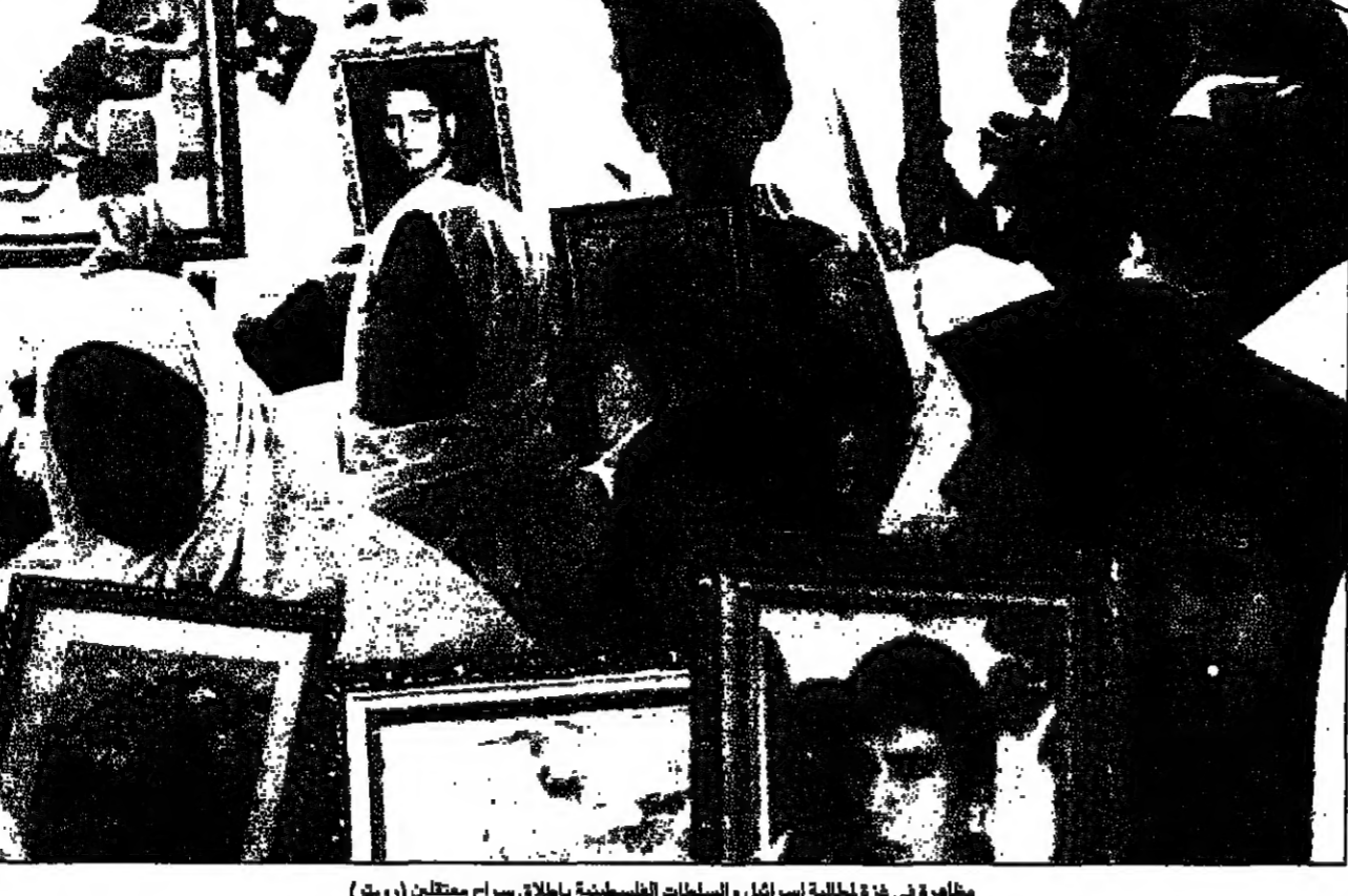
مظاهرة في غزة الحالية اسرائيل والسلطات الفلسطينية باطلاق سراح معتقلين

المبعوث الاوروبي ... رد مصري عنيف على تصريحات للمبعوث الاوروبي حول العلاقات العربية الاسرائيلية.